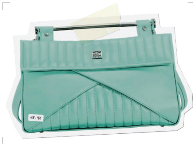
Objekt 15.46 Die erst 2009 gegründete Handtaschen-Manufaktur spezialisiert sich auf Klassiker. Besonderer Wert wird auf Qualität gelegt, damit man die klassischen Stücke lange mit sich herumtragen kann.