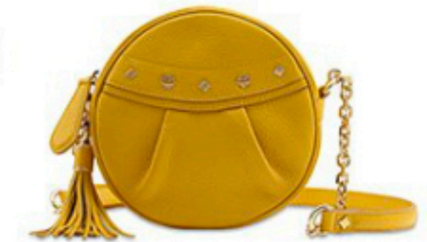
MCM Preis auf Anfrage