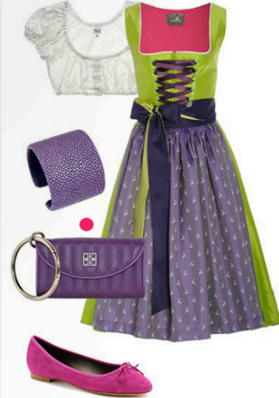
Kitzalm Dirndl mit Schürze 916€; Fräulein Trentini Dirndlbluse 129€; A Cuckoo Moment Armreif 145€; Celia Czerlinski Clutch 250€; Unützer Ballerina ca. 305€