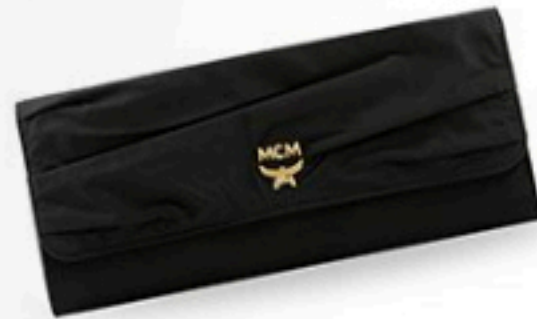
MCM Preis auf Anfrage