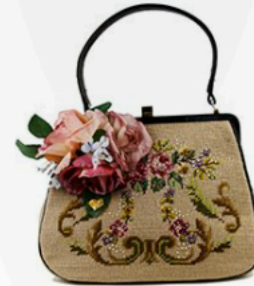
Nic Pink 199€