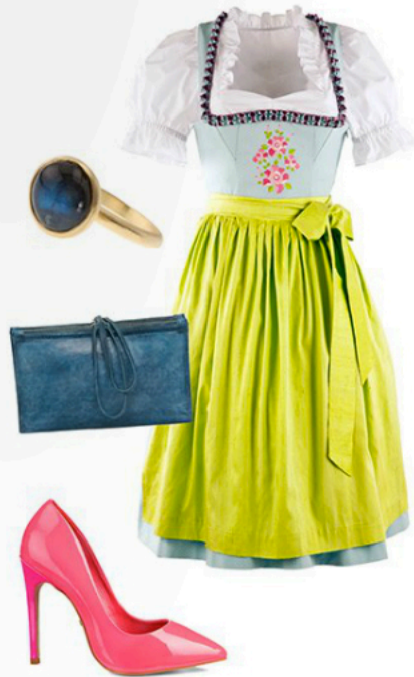
Froschgoscherl Dirndl mit Schürze und Bluse ab 620€; New One Ring 39€; Brand9 Clutch 129€; Buffalo Pumps 119,90€