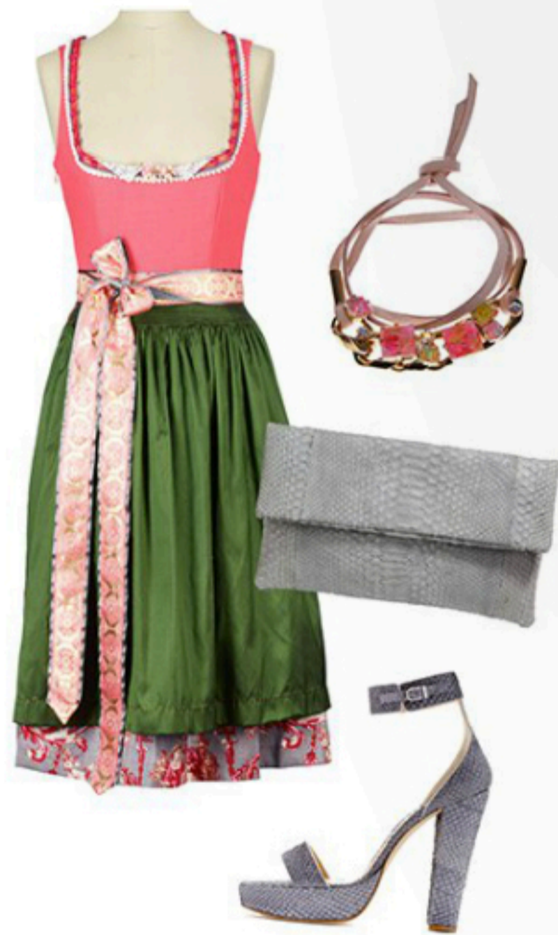
Amsel Fashion Dirndl mit Schürze 899€; Sabrina Dehoff Armband 159€; Unützer Sandale ca. 450€; cute stuff via Daily Obsessions 229€