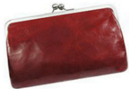
Volker Lang 145€