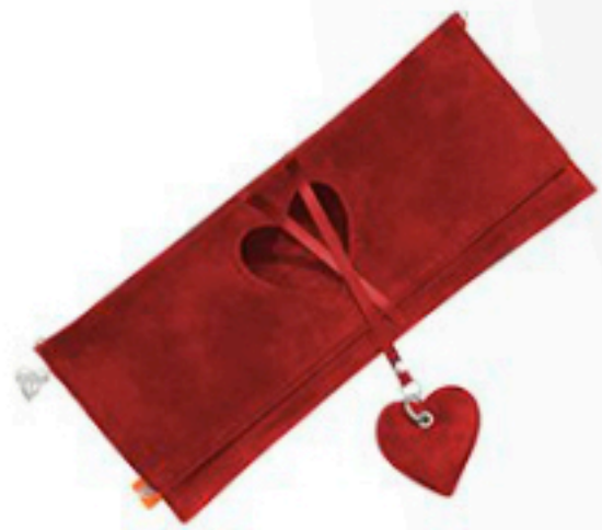
Aviatrix 295€ via Nelou