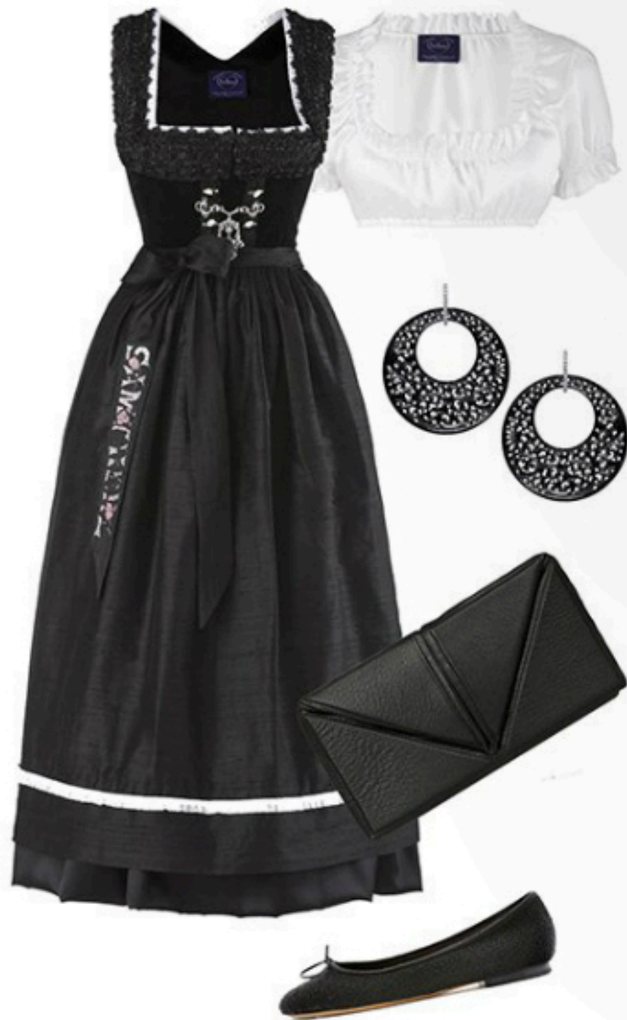
Samtherz Dirndl mit Schürze Preis auf Anfrage; Samtherz Dirndlbluse 190€; Thomas Jirgens Juwelenschmiede Ohringe Preis auf Anfrage; Gretchen Clutch 228€; Unützer Ballerinas ca. 305€