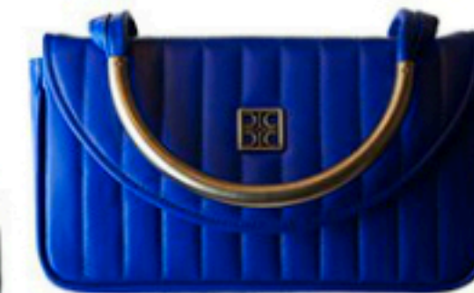
Celia Czerlinski 510€