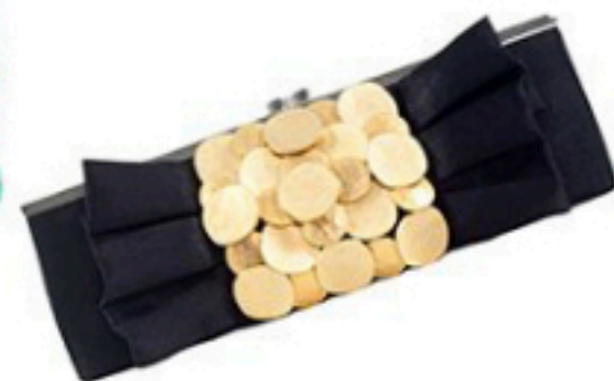
Luxus Berlin 240€ via Nelou