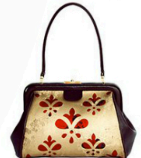
Lydia St. Petersburg 640€