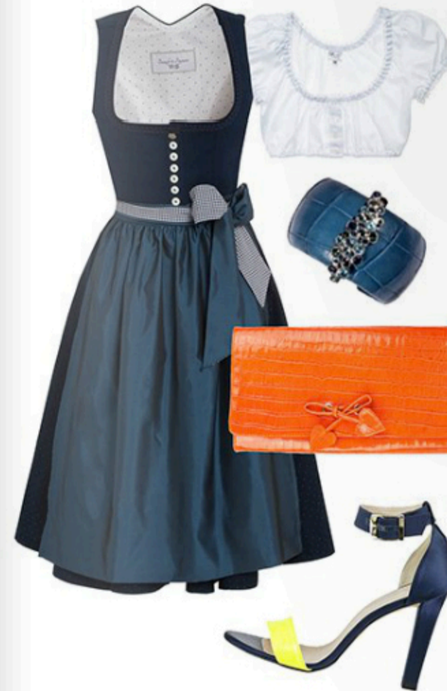
Berzaghi & Freymann Dirndl mit Schürze via Lodenfrey 459€; Fräulein Trentini Dirndlbluse Preis auf Anfrage; A Cuckoo Moment Armreif 1.060€; Minna Parikka Clutch 310€; Vigneron Sandalen via Shoemanic 120€