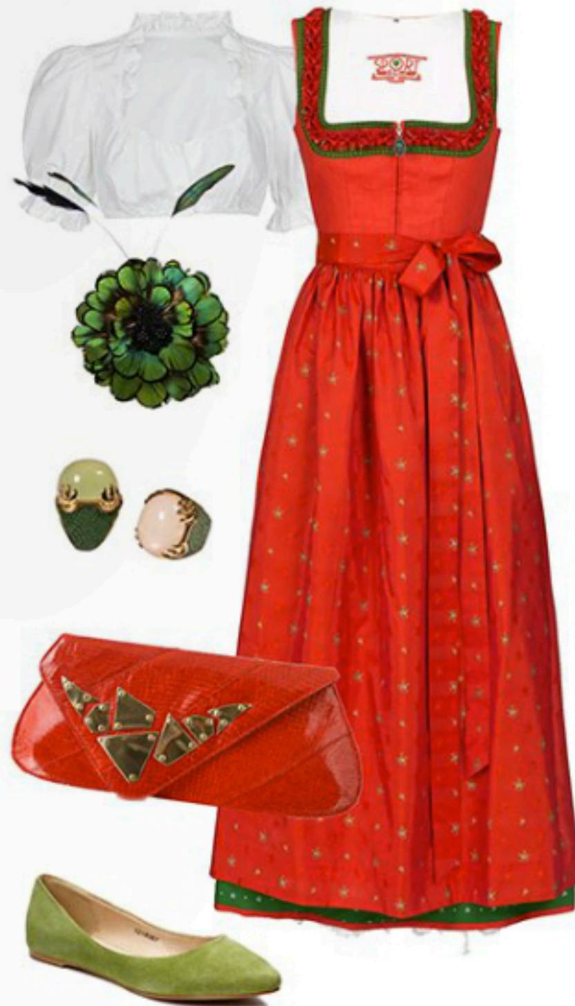
Sportalm Dirndl mit Schürze 589€; Sportalm Dirndlbluse 75€; Billies Federhaarcclip via Dawanda 37,95€; A Cuckoo Moment Ringe jeweils 735€; Gretchen Clutch 3.299€; Friis & Company Ballerinas 76,95€