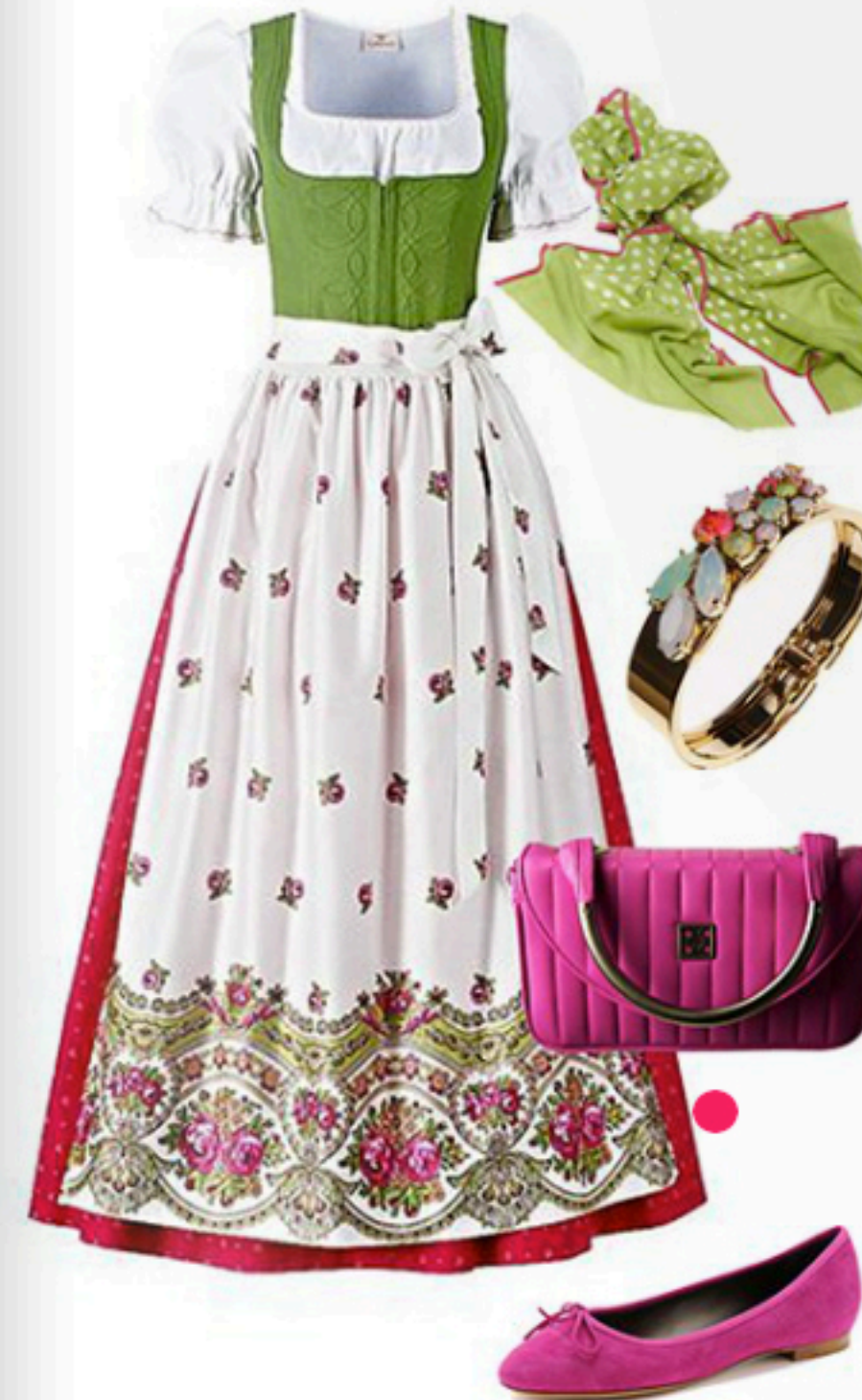
Herzklopfen Dirndl mit Schürze und Bluse via Alpenwelt Versand ca. 225€; P Modekontor Tuch Preis auf Anfrage; Sabrina Dehoff Armreif 239€; Celia Czerlinski Handtasche 510€; Unützer Ballerinas ca. 305€