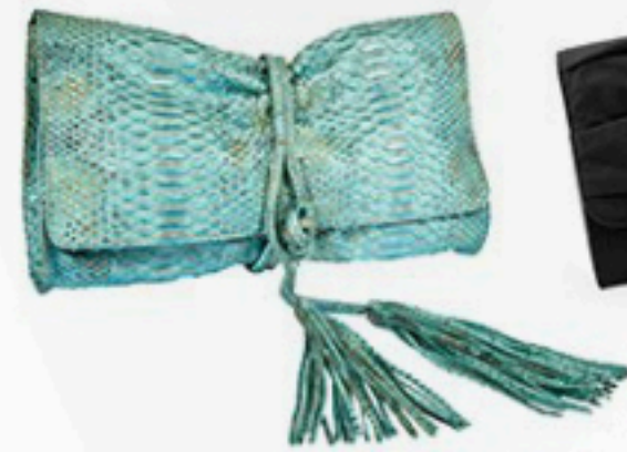
A Cuckoo Moment 1.270€