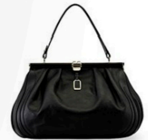
MCM Preis auf Anfrage