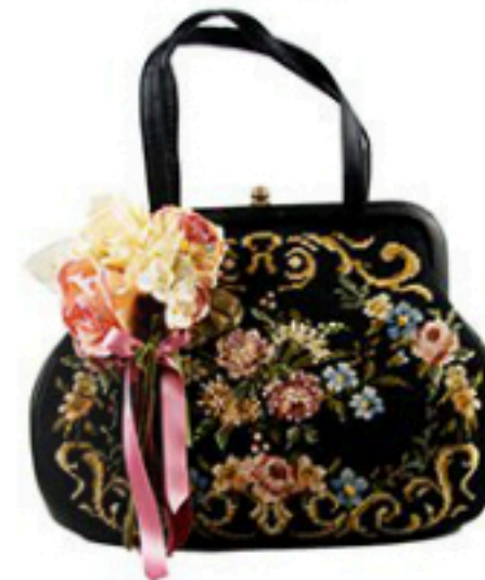
Nic Pink 199€